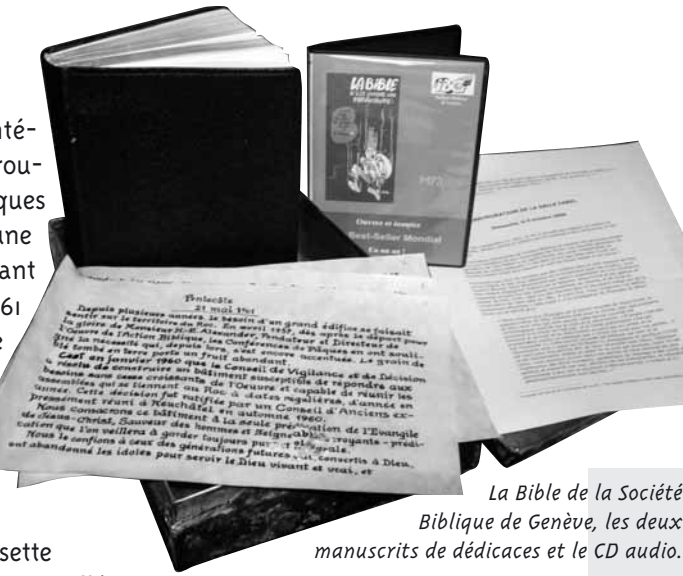
La Bible de la Société Biblique de Genève, les deux manuscrits de dédicaces et le CD audio.