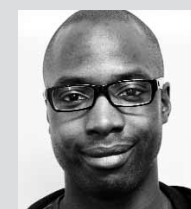
Harry Noël de l'Église évangélique baptiste de Moissy Cramayel (région Parisienne)