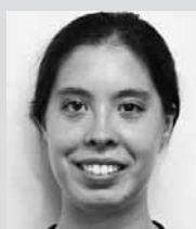
Charity Masters de l'Église Action biblique de Meinier (Suisse)