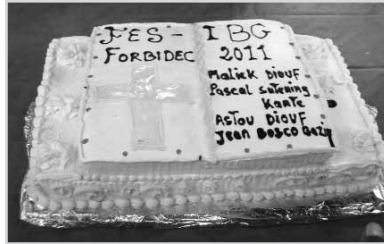
Gâteau offert en l'honneur des finalistes