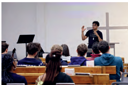
Message au groupe de jeunes à Grenoble