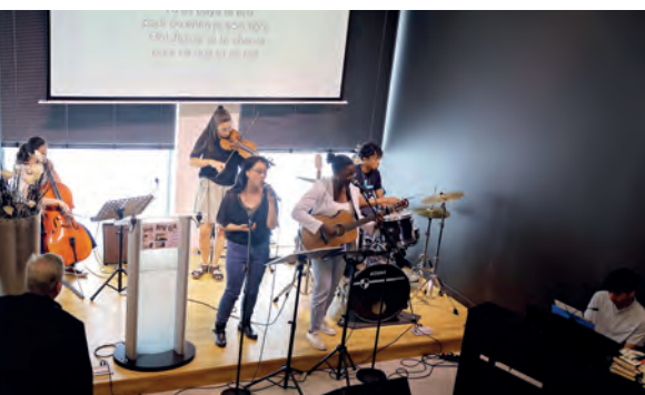
Animation d’un culte à Lyon