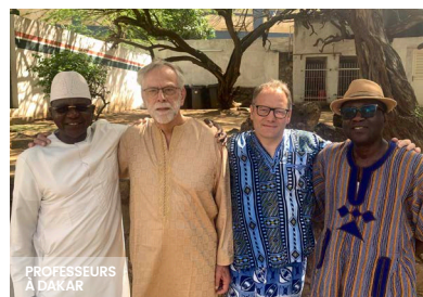
PROFESSEURS À DAKAR