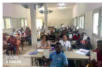
COURS À DAKAR