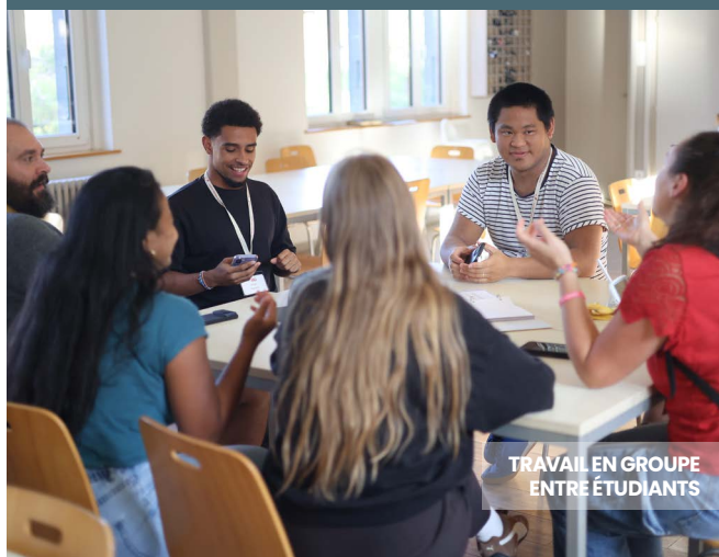
TRAVAIL EN GROUPE ENTRE ÉTUDIANTS

Par ailleurs, pour bien vivre la communauté, les étudiants ont dû se familiariser avec les us-et-coutumes de la vie à l'IBG.