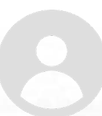
Avec la SIM France