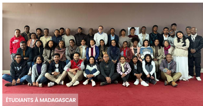
ÉTUDIANTS À MADAGASCAR