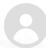
Au Sénégal avec ReachAcross