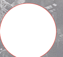
En Afrique du Nord, MENA