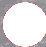
En Asie centrale Encompass