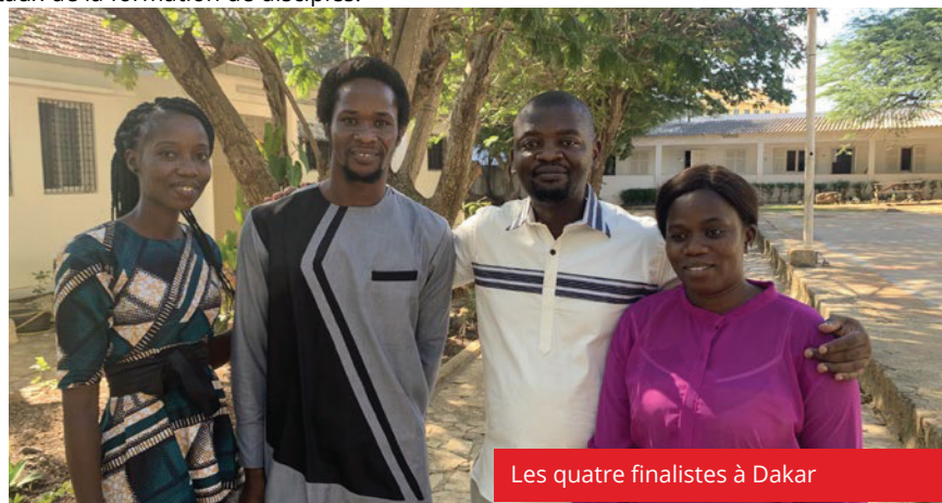
Les quatre finalistes à Dakar

En scannant le QRcode, vous aurez accès à une courte vidéo dans laquelle il présente son travail.