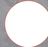
En Afrique du Nord, MENA