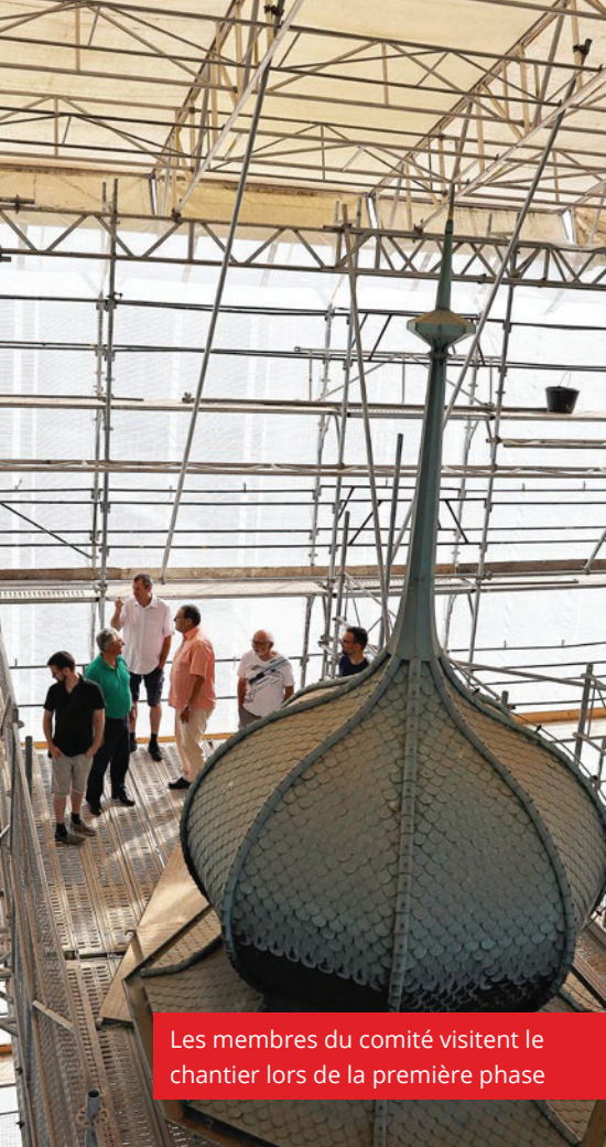
Les membres du comité visitent le chantier lors de la première phase